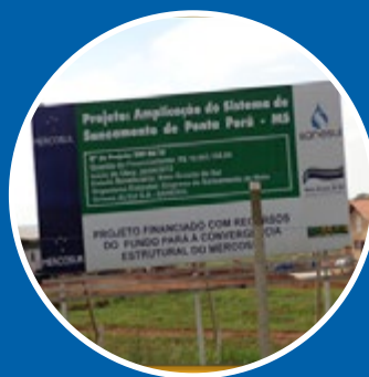
Cartaz de obras – Ponta Porã