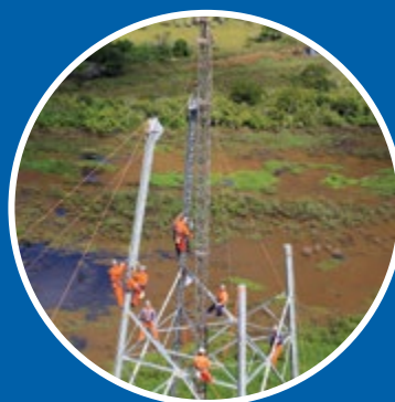
Montagem de torre na Linha de Transmissão Margem Direita – Estação Villa Hayes

Implantação do sistema de 500 kV no Paraguai - construção da linha de transmissão elétrica de 500 kV entre Villa Hayes e a subestação na margem direita da Itaipu Binacional, ampliação da subestação da margem direita e da subestação de Villa Hayes.