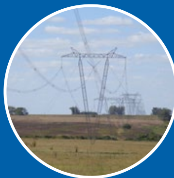
Linha de Transmissão 500kV

Interconexão elétrica de 500 MW entre a República Federativa do Brasil e a República Oriental do Uruguai - linhas de transmissão de extra-alta tensão: San Carlos-Melo e Melo-Fronteira.