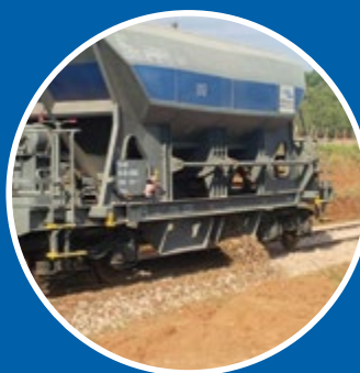
Trabalhos de Vagão Tolva Pedrera

Reabilitação de ferrovias - trechos: ramal Piedra Sola: Tres Arboles (Km 334) – Piedra Sola (Km 392), linha Artigas: Tres Arboles (Km 334) – Algorta (Km 409), Algorta (Km 409) – Paysandú (Km 480), Paysandú (Km 480) – Salto (Km 590), ramal El Precursor: Salto (Km 590) – Salto Grande (Km 603).