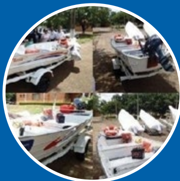
Lanchas para percursos fronteiriços, adquiridas pelo Projeto

O montante aprovado ascendeu a USD 16,3 milhões, dos quais USD 13,8 correspondem ao FOCEM.