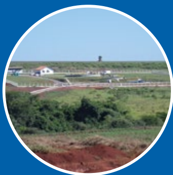
Vista da subestação de tratamento

Até a data de hoje conta com 100% de execução de obras e o sistema se encontra em etapa de operação inicial. A obra abrangeu a construção de mais de 93.000m de rede de esgoto, mais de 3.900 conexões domiciliares e a construção do sistema de tratamento de águas servidas e excretas, com uma Planta de Tratamento de Efluentes e Estações de Bombeio. Isto permitiu atender a mais de 13.000 beneficiários.