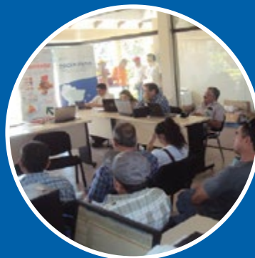
Curso de capacitação a veterinários locais.