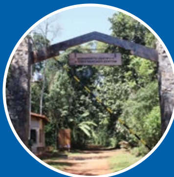
Ingresso ao Museu Moisés Bertoni

Desenvolvimento de productos turísticos competitivos na rota turística integrada Iguazu Misiones, atrativo turístico do MERCOSUL.