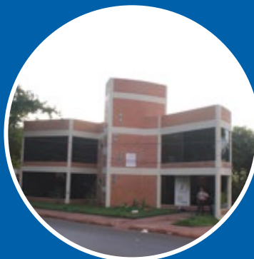
Centro de Atendimento a Turistas